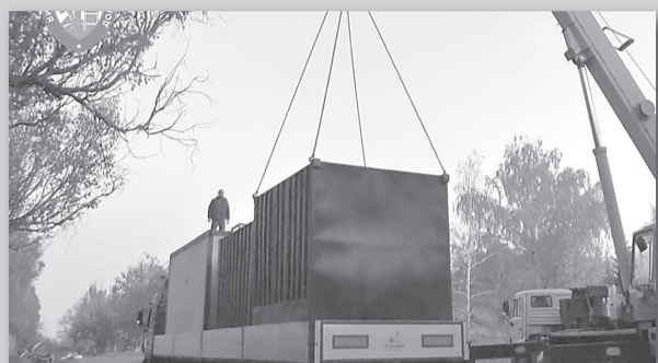
Больница в Светлодарске стр. 2