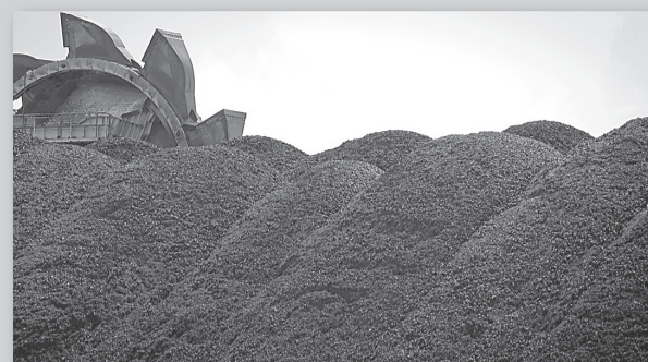
Компенсация за уголь стр. 4