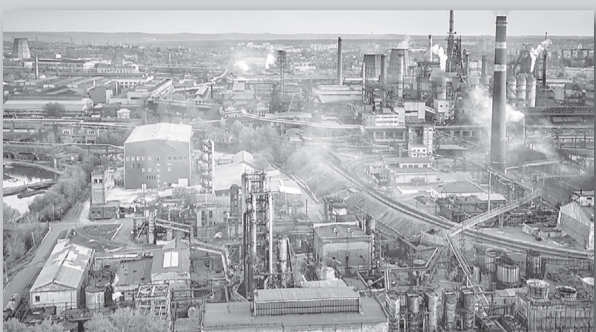
Решения правительства стр. 3